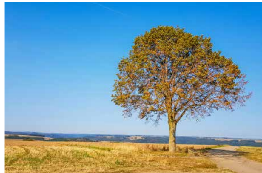
^ De Napoleonboom op het hoogste punt van de Lee Trail, op 500 meter.

En dan begint het echte werk, hoogtemeters maken. Stevig stijgen door het bos, voor de eerste keer op onze route, kilometerslang. Op het ene moment is het pad breed, later is het meer een richel langs een afgrond om verderop weer uit te dijen. Hebben we zelf normaal nog wel eens de neiging om te verdwalen, dan is dat op deze route haast onmogelijk; het witte golfje is nooit ver weg. Soms deelt het een paal met flink wat andere symbolen, want we kruisen onder meer het Victor Hugo Pad, de Sentier de Nord, de GR57 en de Sentier Adrien Ries. We passeren een antieke wegwijzer