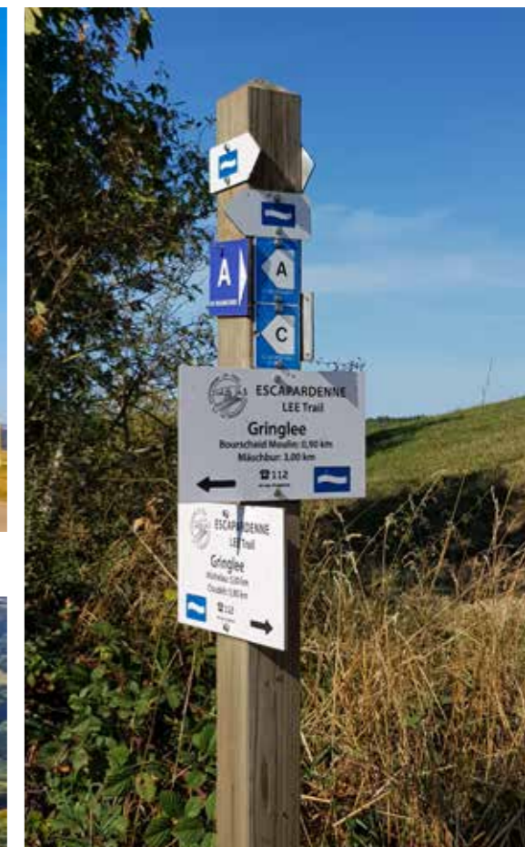
^ Verdwalen kan echt niet. ^ Zicht vanaf de Gringlee op de bocht in de Sûre.

De rotsen op de Lee Trail ga je op en af, op en af. Na een omlaag weet je: straks komt er weer een omhoog