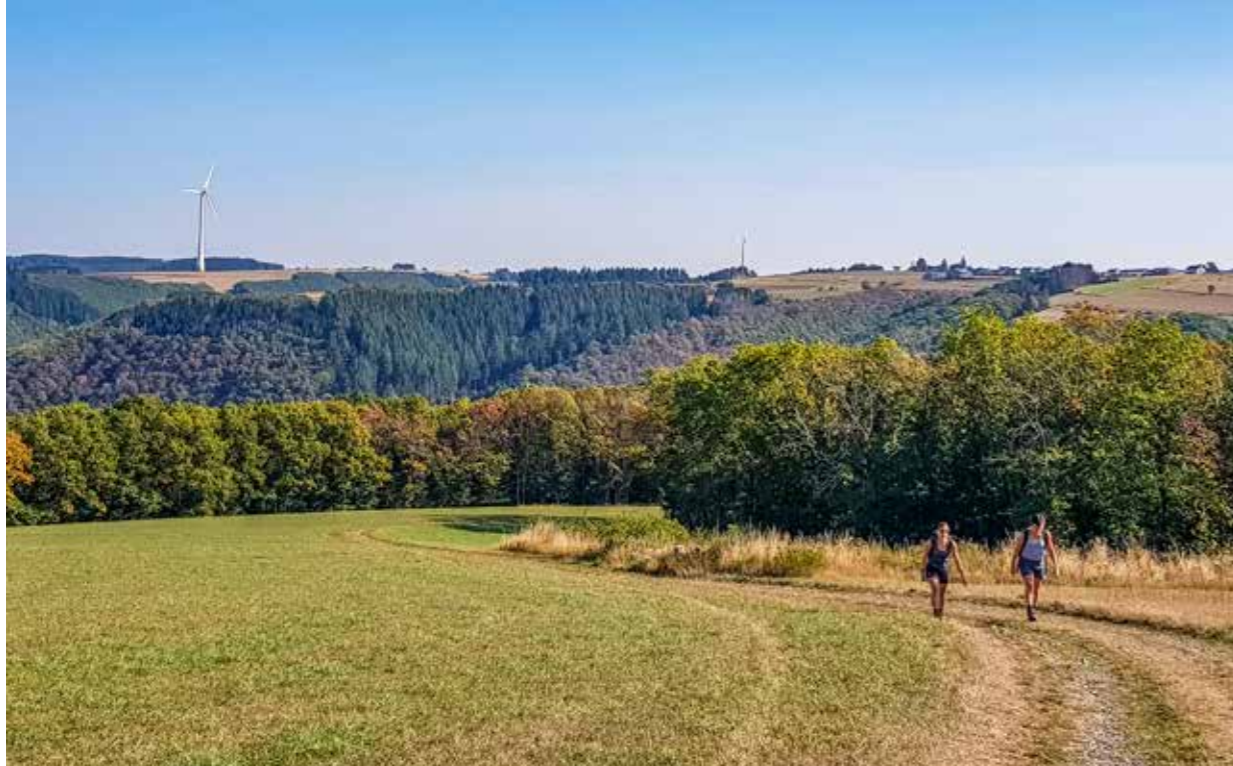
◀ Afwisselend landschap: rotsen, bossen, open veld.