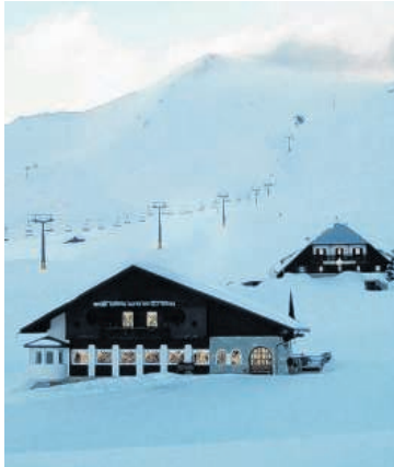
De wereld aan je voeten: Over maagdelijke sneeuw de berg af en met de eerste lift weer omhoog, klaar voor de volgende afdaling, de volgende hut.