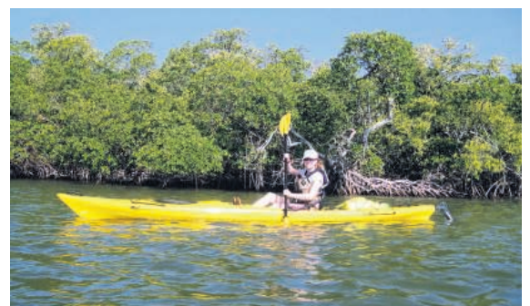
Ruwe handen: Het is even doorpeddelen over de gigantische watervlaktes.

Volgende ochtend, half 7. Everglades City lijkt nog te slapen. De brede straten zijn leeg – slechts af en toe zoeft een auto met boottrailer voorbij en dan wordt het weer stil. Voorzichtig zonlicht geeft de wolken een oranje gloed. Maar schijn bedriegt; aan de waterkant is volop activiteit. Groepjes mannen hebben zich verzameld rond glimmende motorboten. Ze brengen hele batterijen hengels in stelling, praten over vissen en de weersverwachting en zetten een blikje cola aan de lippen. En dan wordt de motor gestart, gaan de trossen los en beginnen ze aan een ongetwijfeld fantastische vistrip. Snoek, baars, tarpon, permit, cobia, roodbaars, het belooft wat. →