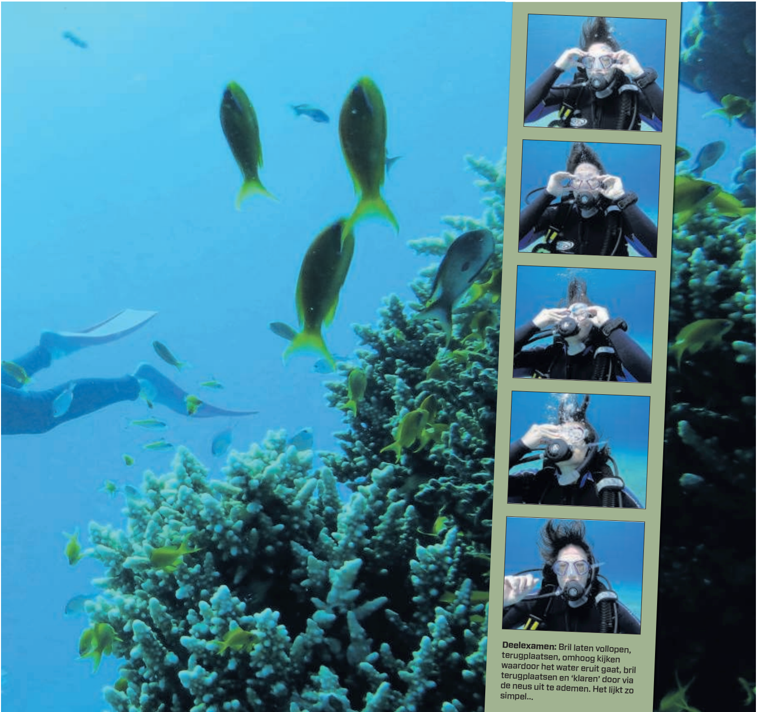
Deelexamen: Bril laten vollopen, terugplaatsen, omhoog kijken waardoor het water eruit gaat, bril terugplaatsen en 'klaren' door via de neus uit te ademen. Het lijkt zo simpel...