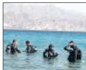
Duikstad: De grote hotels liggen aan het noorderstrand, de duikscholen meer naar het zuiden. Duikers lopen daar zo de Golf van Akaba in.

→ strakke duikpak. Hierbij vergeleken blijken het klaren van de oren en het diepe ademen van de eerste dag een eitje.